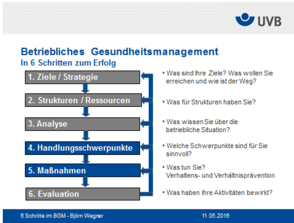
Abbildung 1: Darstellung 6-Schritte-Modell

der durchgeführten Maßnahmen zu erhöhen und im weiteren Verlauf auch zu evaluieren (Schritt 6).